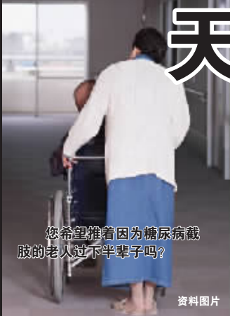
您希望推着因为糖尿病截肢的老人过下半辈子吗?