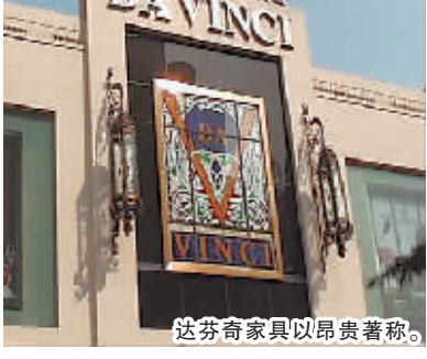
达芬奇家具以昂贵著称。