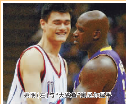
姚明(左)与“大鲨鱼”奥尼尔握手