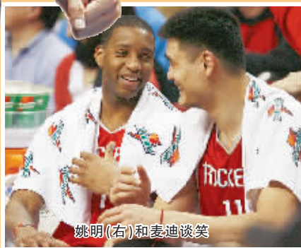
姚明(右)和麦迪谈笑