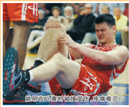
姚明在比赛时被撞受伤,疼痛难忍