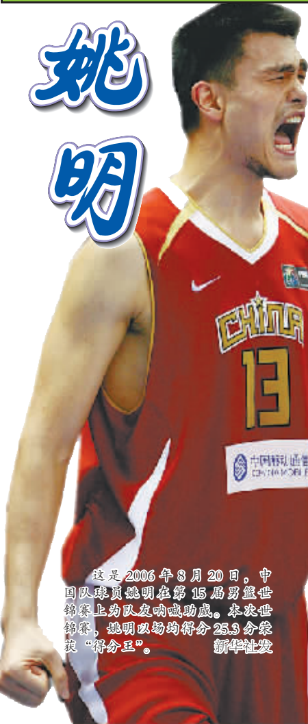
这是2006年8月20日，中国球员姚明在第15届男篮世锦赛上为队友呐喊助威。本次世锦赛，姚明以场均得分25.3分荣获“得分王”。