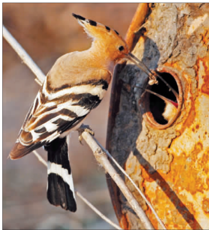
冠军作品《最后的晚餐》。