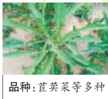
品种:苜蓿菜等多种