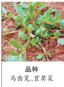
品种 马齿苋、苜蓿菜