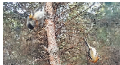
被粘网捕获的小鸟。

20日6时,记者随工作人员来到青年林。进入林间不到200米就发现一处粘网和捕鸟笼。记者看到,粘网从地面拉起至空中大约7米高,长约15米,网线纵横交错,网孔直径不超过1厘米,若不是先看到捕鸟笼,细密的粘网还真不容易被发现。20多只鸟挂在粘网上,鸟的翅膀、爪子上缠着多层黑色网线,大多数还在挣扎,有两只已经死去。附近有好几个悬挂在树杈上的捕鸟笼,笼子里有不停鸣叫的鸟,现场还有几台录音机,用来播放鸟的叫声。据市林业局森林资源管理处王建国处长介绍,鸟笼中的鸟为“引鸟”,捕鸟者用这