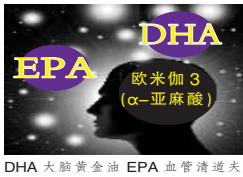
DHA 大脑黄金油 EPA 血管清道夫

欧米伽3(α-亚麻酸)又被称为“血管清道夫”是一种人体必需脂肪酸,欧米伽3既不能用化学的方法人工合成,又不能人体自行生成,必须通过食物进行补充。欧米伽3(α-亚麻酸)在人体内能转化为DHA、EPA,而DHA和EPA则在大脑和中枢神经系统发育中扮演着非常重要的角色。如果欧米伽3(α-亚麻酸)的摄入量不足,就可能会让你的身体越来越差!