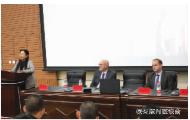
加方教师及顾问相关资质