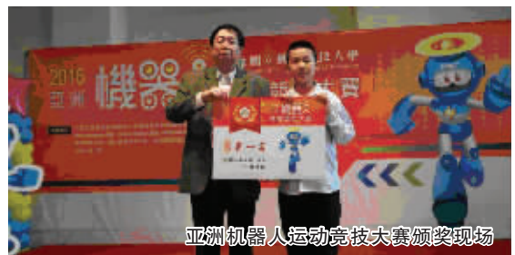
亚洲机器人运动竞技大赛颁奖现场