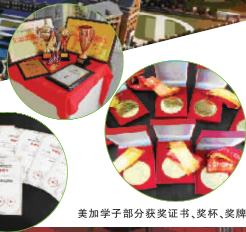
美加学子部分获奖证书、奖杯、奖牌

艺体科心: 异彩纷呈的艺术、体育、创新科技和心理健康教育从不同角度对学生体验互动、审美情趣、热爱生活、增强体质、正确价值观形成等方面具有积极作用。建设功能完善的信息网络及软硬件环境,多媒体、多功能一体机班班通。建立一流的科学实验室、科技成果展室,科技专家进校园;建立科技传统项目——电脑机器人与生物科技创新。建立温馨的心理咨询室,积极引导健康心理。这些特色体现在学部设计了大量的提高学生动手能力、科技创新能力和艺体素养的课程。