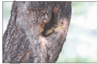
鸳鸯宝宝跃跃欲试。