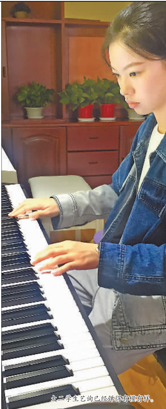
大二学生艺询已经弹得有模有样。

在道里区某大厦内有一间屋子,装修风格小清新,配有咖啡机,还有酒吧台、投影仪、各种桌游游戏,几台电钢琴。很难想到这里其实是一间速成钢琴教室,半小时就能教会你弹一首钢琴曲,学一个月就可以把流行歌曲边弹边唱出来。开班不到一个多月,学员20余人,他们的心思不尽相同,有为求婚的,有想扩大交际圈的,有要在公司年会亮相的,还有全职妈妈打发无聊时间的。在时下儿童教育如此火热的今天,老板说,本班不招孩子,这是大人的圈子。