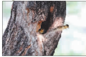
一只宝宝勇敢跳下。