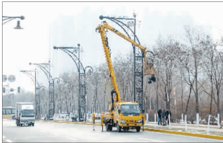
昨日,哈市路灯管理部门对群力新区景江东路等主干街路沿线的景观路灯进行全面养护维修,既要夜晚绚丽又要保证出行安全。

进人才实施办法》,按照“不求所有,但求所用”的原则,以“政府引导、市场调节、单位自主、契约管理、待遇激励”的方式,在不改变人才的人事、档案、户籍、社保等关系前提下,本着以用为本,发挥实效,解决关键领域高素质人才稀缺等问题,汇集各类优秀人才参与我省经济社会建设。