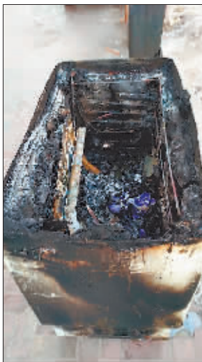
烧毁的冰箱还在楼道内，暂时无人认领。

本报讯（记者 李洋 文/摄）昨日12时许，在群力新区民生尚都祥园内，一放在居民楼五层楼道内的冰箱起火爆裂，附近居民紧急赶来救火，所幸事故没有造成人员伤亡。起火原因疑似有人将冰箱电源私接到楼道内的声控灯上，导致冰箱电路短路起火。目前，烧毁的冰箱暂时无人认领，消防部门已介入，并对事故原因作进一步调查。