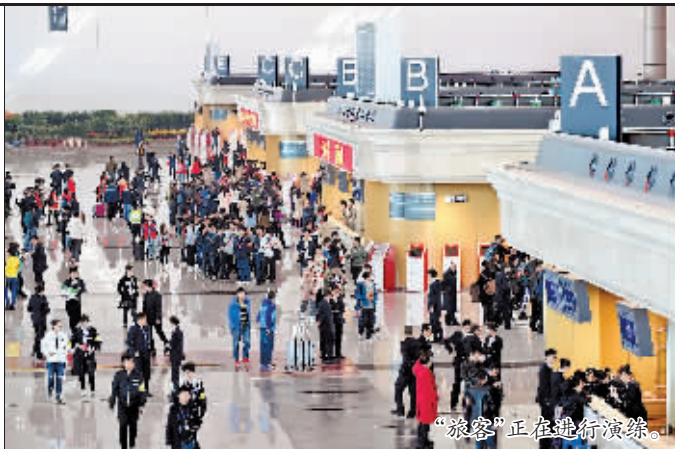
“旅客”正在进行演练。

昨天9时,由大学生志愿者和机场员工扮演的2000多名“旅客”,陆续来到哈尔滨机场T2航站楼。9时30分演练开始后,所有“旅客”分批前往T2航站楼出发大厅,模拟演练国内