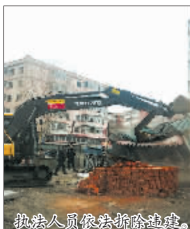
执法人员依法拆除违建。

昨天,道里区城管行政执法局、群力街道办事处、辖区派出所等单位共出动百余人,对规划青海路上的违法建筑依法进行拆除。2小时共拆除了40处违法建筑,面积约1000平方米。