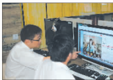
执法人员巡查网络直播平台。