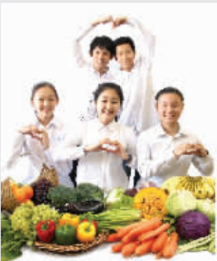
营养配餐，科学健康