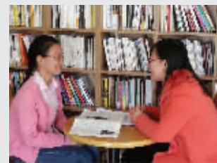
独具特色的导师制度