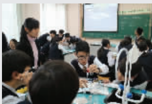
小班授课提高教学质量