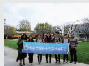
海外研修活动，开阔视野、了解世界