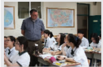
中美国际班课堂教学