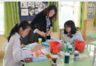
分层走班教学、学分制评价充分尊重个体差异