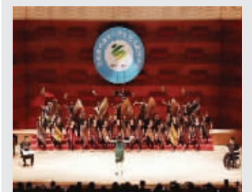
全国中学生艺术比赛一等奖