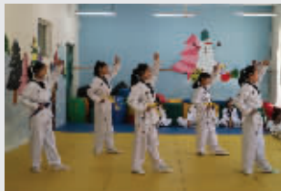
丰富多彩的艺体教学 促进学生个性化发展