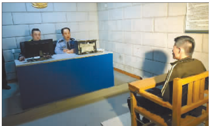
涉酒驾人员接受交警讯问。

酒驾极易导致交通事故发生，严重危害公共安全，是一种对自己和他人不负责的违法行为。驾驶人在加强自律的同时，亲朋好友应尽到提示、劝阻、照顾等义务，有效预防酒驾行为发生。