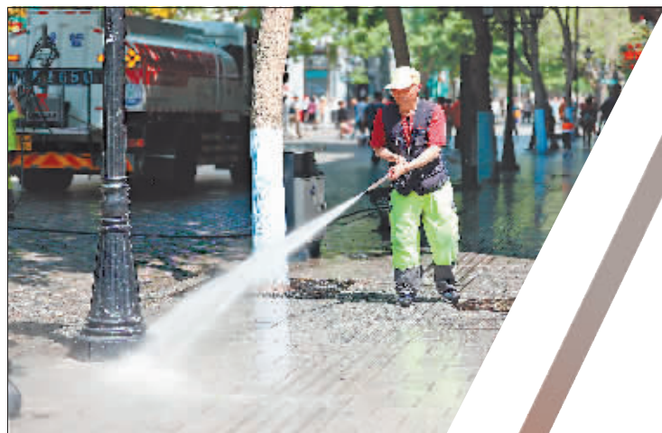
环卫工人在中央大街喷水降温。