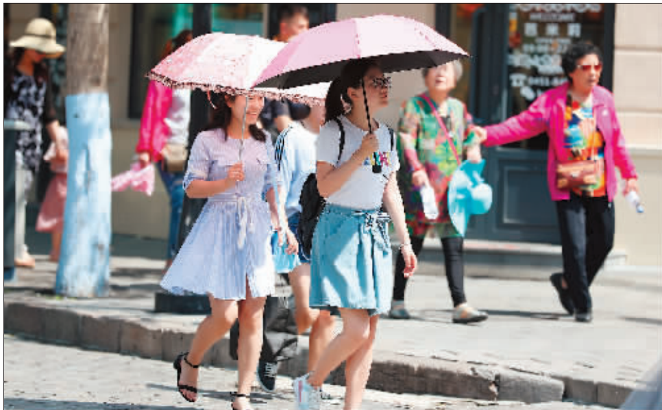
街头美女穿上夏装。

好消息是,下一气温将迎来明显下降,白天最高温出溜到28℃,下周二白天最高温23℃,炎热消退。