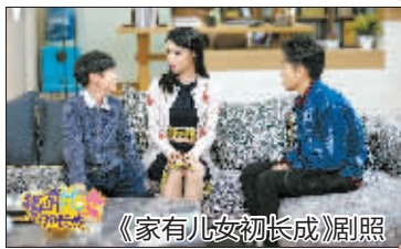
《家有儿女初长成》剧照