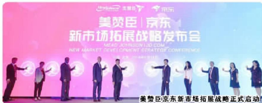
美赞臣京东新市场拓展战略正式启动

美赞臣和京东借助移动互联网技术联手打造的涵盖“商流+物流+信息流”一体化商业模式显然是该领域的创新。身在新兴城镇市场的小母婴店主,只要在“美赞臣母婴店俱乐部”中注册认证,使用移动程序下单,就能通过京东覆盖全国的高效、专业、安全的物流体系,最快在48小时内收到美赞臣的产品。这种从品牌商到销售终端的无缝对接,对小店主而言,让门店拥有更灵活的备货经营方案;对美赞臣而言,借助京东的物流供应链,可以更低成本、更高效打通并加强美赞臣对末端渠道的管理。这个美赞臣+京东的线上线下一体化全新合作模式,将成为母婴行业拓展B2B平台的标杆。美赞臣大中华区首席执行官睿恩达先生对此充满信心,他表示:“美赞臣已与京东建立创新的伙伴关系,借助京东平台化、模块化、生态化的无界营销解决