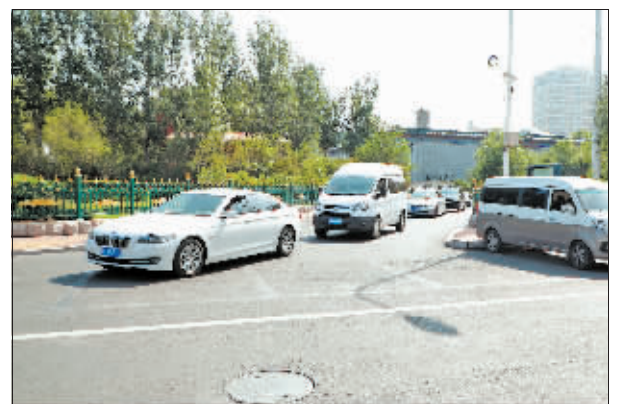
昨天,道里区江畔路与九站街交口道路渠化改造完毕,此次改造对该路口原有直角转弯车道进行了改造,提升该路段车辆通行能力,缓解周围区域交通拥堵。

是由国内外黑龙江商会及黑龙江籍企业家自发组织的非官方社会组织。截至目前,拥有世界各地商会团体会员80余家、个人会员100余人。龙商国际联盟每年举办一届领袖峰会,每次会有不同的主题。峰会是各行业巨擘和著名企业家同台论道,科技界、政界、商界、投资界相互融合的平台。