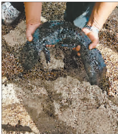
大鲵长着四条腿儿。

经测量大鲵体长72厘米,体重2.9千克,活动自如,体表无外伤,推测在水库中已生活了一段时间。因日湖水水质优良、鱼类丰富,且有工作人员巡查看护,民警将大鲵重新放回水库中。