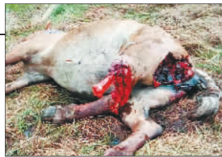
马屁股和后腿部分被咬掉。