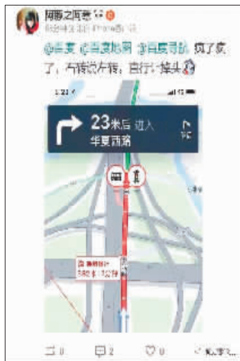
明明要右转，却让左转。