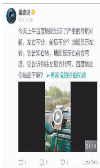
地图显示左前方弯道，告诉你往左后方转弯。