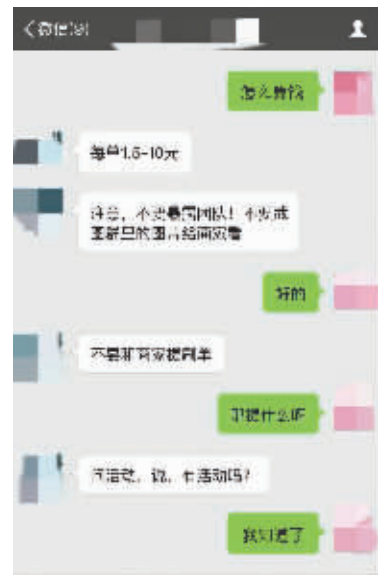
记者接受刷单“培训”。