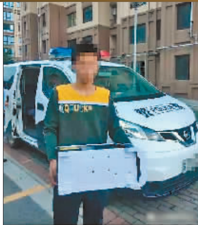
14岁的黑客。

7月12日,该企业工作人员到大庆市公安局网安支队报案,称数据丢失造成经济损失10万余元。大庆警方立即成立了专案小组。最后,民警确定了该黑客