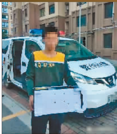
14岁的黑客。

7月12日,该企业工作人员到大庆市公安局网安支队报案,称数据丢失造成经济损失10万余元。大庆警方立即成立了专案小组。最后,民警确定了该黑客