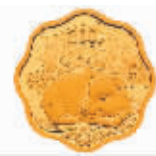
15克梅花形精制金质纪念币背面图案