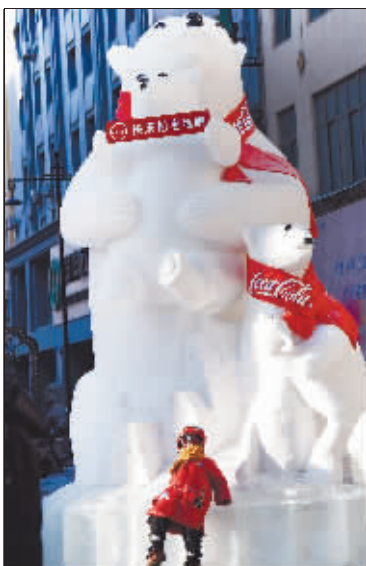
近日，天南海北的游客聚集于冰城百年老街赏冰玩雪，共享找“冰冷”的乐趣。

2019年1月7日，江上派出所民警在道外北七道街江边巡逻时，发现经多次责令整改，但拒绝履行的违法行为人高某，在江上使用雪地摩托车非法经营拉游客，被依法行政拘留3日。