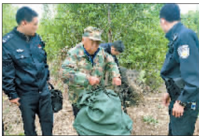
市森林公安局民警现场收缴、销毁粘网、滚笼等捕鸟工具。