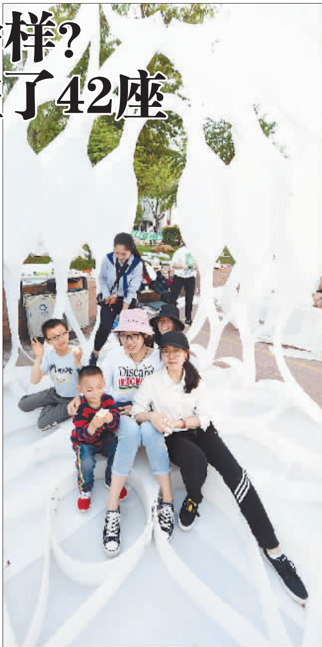
一等奖作品：哈尔滨工业大学《聚·源》

哈工大学生创作的《寻安》由数块塑料中空板编织而成，连接处使用了超过2000颗铆钉，密集而精巧的竹编手法让这一建筑格外稳固，外观看起来类似鸟巢。