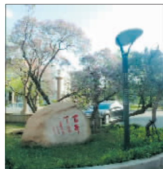
和平邨宾馆内的百年丁香。

年丁香可供市民免费入园观赏，其位于森林街南门一角的北苑附近。这棵树的品种是暴马丁香，目前长势依旧很好，树高约15米，树径