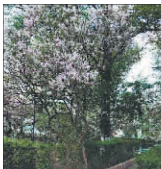
市政府第一幼儿园内的百年丁香。