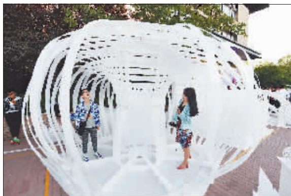
吉林建筑大学《巢南枝》

本次比赛还迎来了由内蒙古工业大学、大连理工大学、吉林建筑大学、哈尔滨理工大学、东北林业大学等5所北方寒地建筑院校的学子。哈尔滨理工大学学生创作的《寻影》是全场“海拔”最高的建筑，最高处达3.5米。