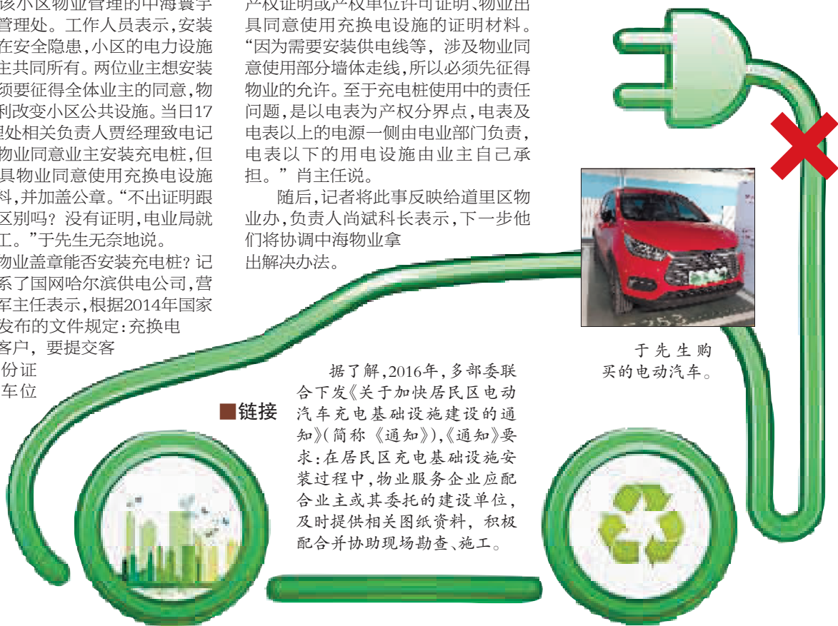
于先生购买的电动汽车。