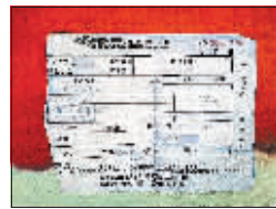
郭先生交200元预约金的票据。