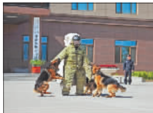
群犬扑咬项目考核。