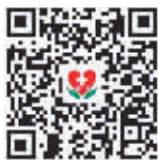
哈报在医线 二维码

关注微信公众号“哈报在医线”,直接留言。 格式:姓名+年龄+性别+联系方式+想点的名医姓名+病史。