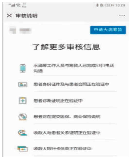
记者在水滴筹上发现,有的筹款人信息并未被完全核验已开始筹款。