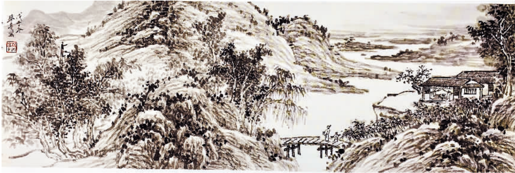
《心慕前贤之一》 68cm × 34cm

出版有《中国当代山水画名家作品选——蔡亮》、《中国书画博览——蔡亮》、《蔡亮水墨鉴赏》、《名家推介——蔡亮扇面选》等个人画集和合集多种。多幅作品入选全国各类大型展览并获奖。作品被多家文博机构和私人收藏。