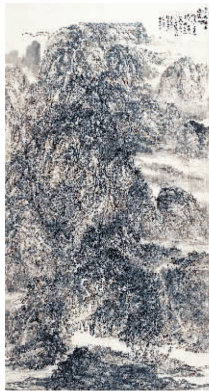
《清风雅雨过溪山》 200cm × 110cm