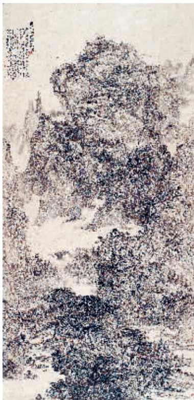
《愿借古法开新境》 200cm × 100cm