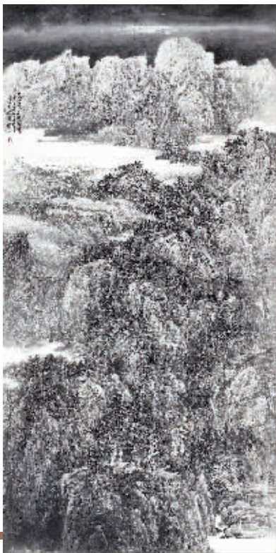
《夏山过雨六月寒》 200cm × 100cm