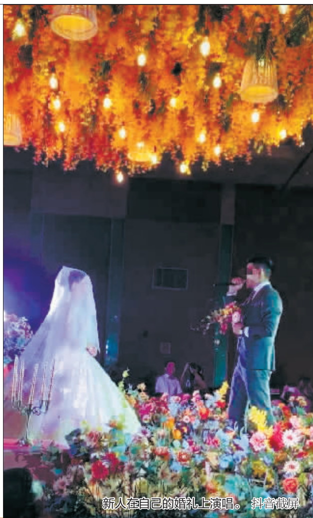
新人在自己的婚礼上演唱。抖音截屏

哈尔滨的专业录音棚按时间收费,如果业余歌手用1个多小时能录完整首歌,录制、演唱指导加后期修音,根据录音棚的不同档次,收费从700元到1600元不等。专业人士还能根据新人的要求把歌曲进行段落重组和剪辑。比如嫌歌曲太长,不想唱完整一首歌的,可以用技术手段“掐头去尾”,但听起来还是有高潮、有副歌,很完整。与请专业歌手和乐队相比,新人假唱的成本更低,现场气氛却嗨到爆,所以大受“90后”新人的欢迎。