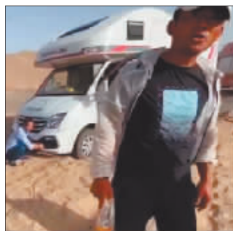
男子威胁拍视频的博主。