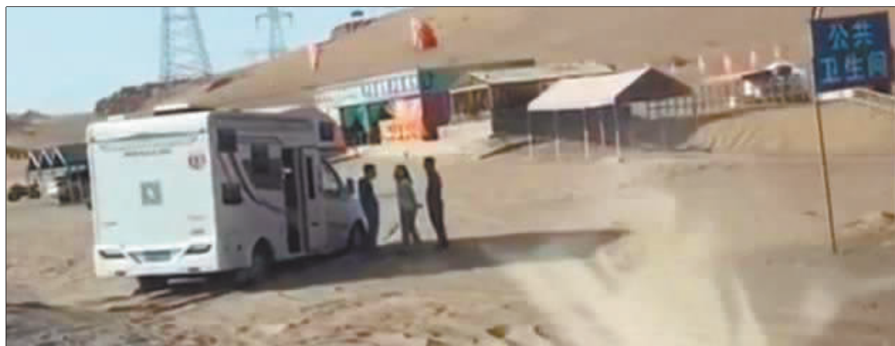
游客的房车陷入沙堆中。

近日,甘肃省敦煌出现“专坑游客的公厕”引发关注。厕所附近沙子易陷,途经车主陷入沙堆后,沙漠越野基地人员索要“巨额拖车费”,且不允许其他游客帮忙。从拍摄的视频看,这名沙漠越野基地人员颇为嚣张,不但阻止拍摄,还暴力威胁他人。