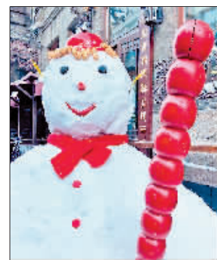
街区内形态各异的“雪作品”。

中华巴洛克历史文化街区是哈尔滨市重要的旅游资源。为进一步将“冷资源”转化为“热经济”,满足游客赏冰乐雪的需求,