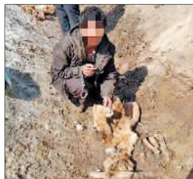
狩猎者指认狗子皮。

本报讯（记者 王铁军）近日，黑龙江林区多家法院对5起非法狩猎案件进行集中宣判，涉案7名被告人分别被判处有期徒刑六个月至有期徒刑一年不等。