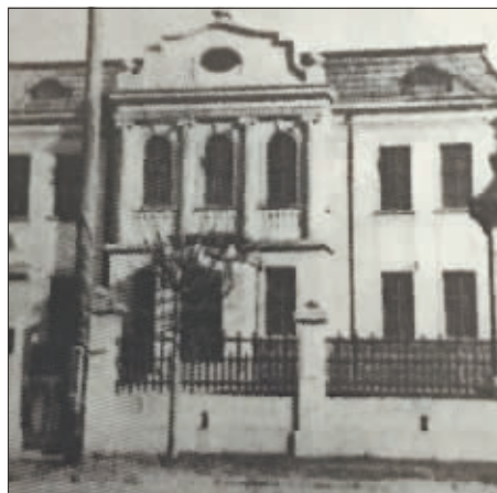
1928年5月位于现南岗区民益街的电台台址。

因1926年10月1日开播，哈尔滨无线广播电台成为我国官办的第一家城市电台；因1945年8月20日发出“哈尔滨广播电台”的呼号，而成为中国共产党领导的第一家大城市广播电台，被载入我国广播史。