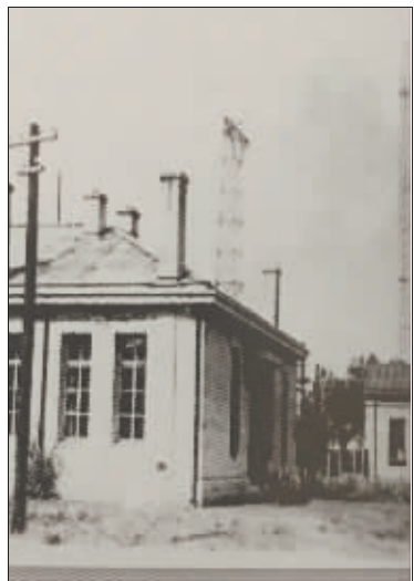
1920年位于马家沟的无线电报房和发射天线。

20世纪20年代初，收音机在中国的大城市里也是稀罕物，那时哈尔滨市拥有收音机1200多台。1926年刘翰在哈尔滨市内观察到一些日本洋行的建筑上，架设了多条天线，经查，得知是日本人利用中东铁路的专用长途电话收集信息，用无线电台出售新闻，这明显侵犯了我国的电信主权。刘翰先生多次向地方当局反映，提出建议。地方政府与日本人交涉，强令他们拆除了搭建的无线电台。